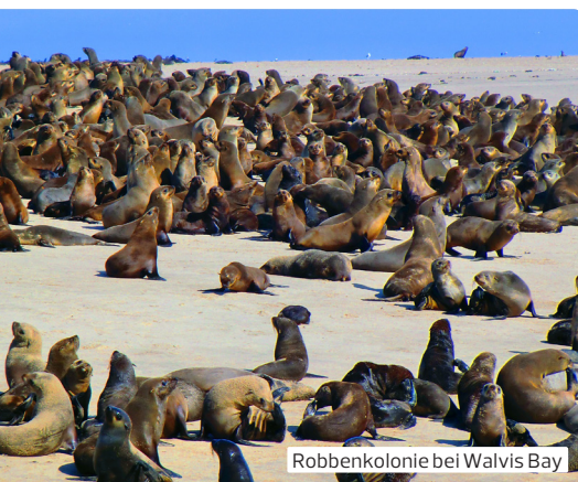
Robbenkolonie bei Walvis Bay

1. Tag: Deutschland – Windhoek (Mo) Flug von Frankfurt/M. nach Windhoek.